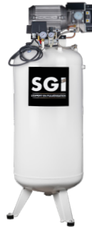
Compresseurs 150L/200L verticaux

Réf. BREVA3-24M Réf. BREVA3-50M Réf. BREVA3-100M