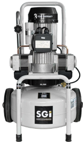
Compresseurs 24L/ 50L/100L

Réf. BREVA3-24M Réf. BREVA3-50M Réf. BREVA3-100M